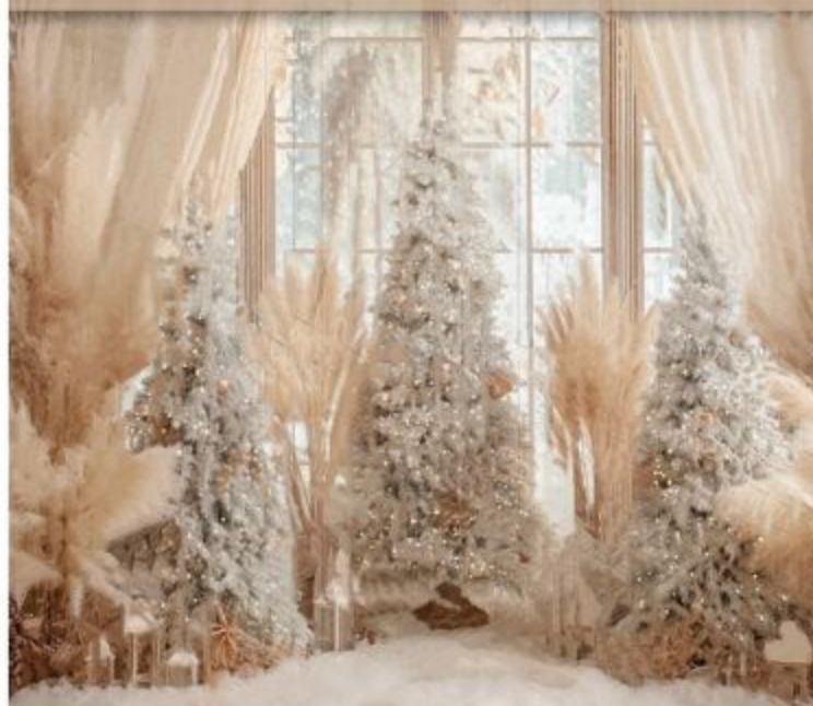
CHRISTMAS PAMPAS SIDE www.colorsanddrops.com