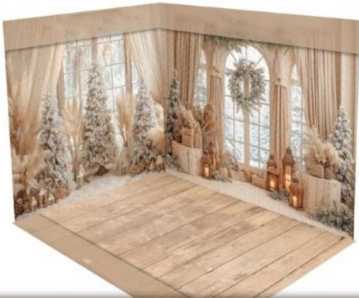
ROOM CHRISTMAS PAMPAS www.colorsanddrops.com